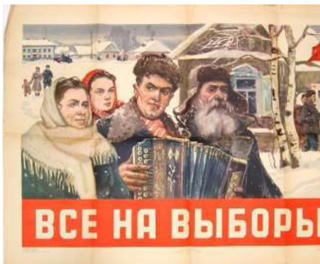
Плакат № 1