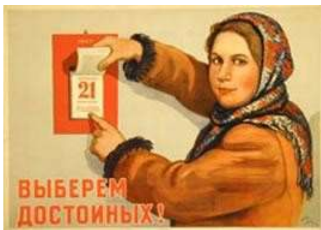
Плакат № 3