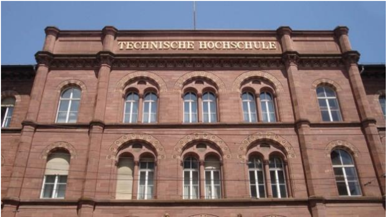
Technische Hochschule Karlsruhe.

In Deutschland kannst du an Universitäten, Fachhochschulen sowie Kunst-, Film- und Musikhochschulen studieren. Welcher Typ der richtige für dich ist, hängt unter anderem davon ab, was du studieren willst. Es gibt außerdem eine Unterscheidung in staatliche und private Hochschulen. Die Qualität ist an allen vergleichbar gut.